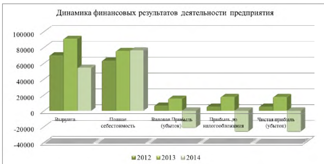
Рисунок 1 - Динамика финансовых результатов деятельности предприятия